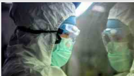
Coronavirus, cos'è il Comitato scientifico

ROMA – La chiusura delle scuole decisa dal governo è un provvedimento utile ed efficace per contrastare il contagio da coronavirus? Alle perplessità generali, si erano aggiunti in effetti i rilievi, le riserve e i dubbi di una autorità scientifica importante, quella del Comitato scientifico. In sostanza il governo ha preferito non ascoltare il parere, non vincolante, di queste personalità.