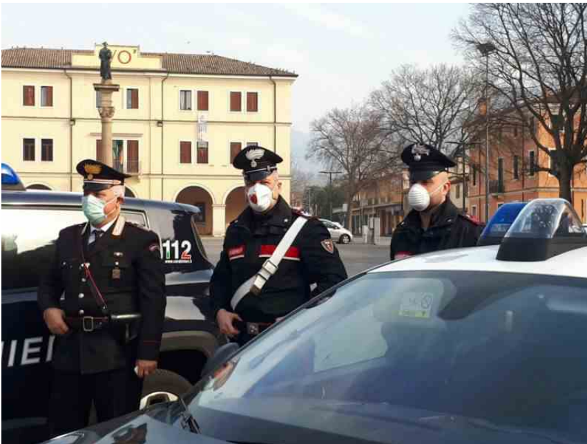
vo euganeo (Photo: )

Sono attivi dalle ore 8.00 i varchi di accesso al comune di Vò, come misura per contenere la diffusione del Coronavirus. Al momento sono presidiati da Carabinieri e Polizia. Il sindaco ha però già evidenziato un problema. "Uno dei posti di blocco, al confine con Bestia, dev'essere spostato più indietro, altrimenti 'taglia' fuori dal contenimento una cinquantina di famiglie della frazione di Zovon".