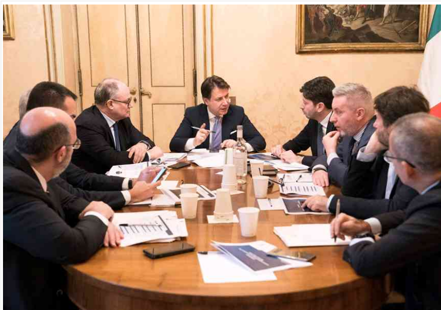
Il tavolo interministeriale sul Coronavirus

Oggi, a Palazzo Chigi si è riunito un tavolo interministeriale al quale hanno partecipato oltre al presidente del Consiglio dei Ministri, Giuseppe Conte, i ministri della Salute Roberto Speranza, degli Esteri e della Cooperazione Internazionale Luigi Di Maio, dell'Economia e delle Finanze Roberto Gualtieri, dei Beni e delle Attività Culturali e del Turismo, Dario Franceschini, della Difesa, Lorenzo Guerini, il sottosegretario all'Interno Vito Crimi e il capo del Dipartimento della Protezione Civile Angelo Borrelli.