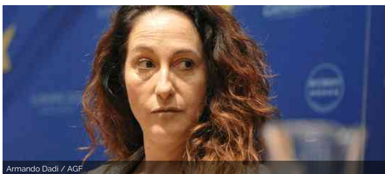
Armando Dadi / AGF