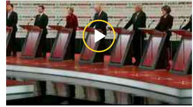
I candidati Dem alla Casa Bianca commentano l'impeachment contro Trump

Se avete correzioni, suggerimenti o commenti scrivete a dir@agi.it