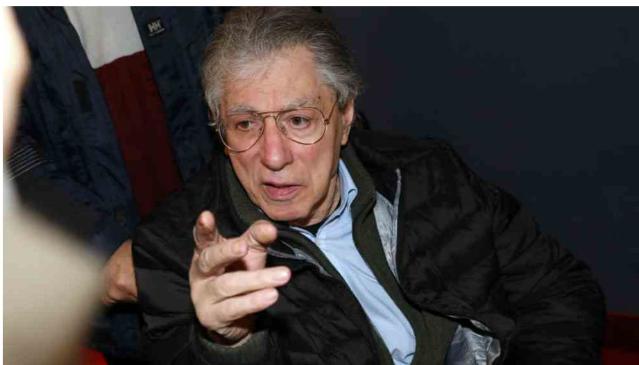
📷 Umberto Bossi

🗨️ Bonaccini è stato bravo ad agganciarsi per tempo al treno di Lombardia e Veneto, con il progetto di regionalismo differenziato ". Sta tutto in questa frase, riportata oggi da Repubblica in una lunga intervista di Gad Lerner a Umberto Bossi , l'importante - e per certi versi ingombrante - endorsement da parte del fu capo del Carroccio Umberto Bossi nei confronti del presidente riconfermato Stefano Bonaccini , uscito vittorioso dalle elezioni regionali. Il tema è di quelli che anche a sinistra hanno fatto discutere, ovvero quello dell' autonomia delle regioni nelle materie di competenza dello stato.