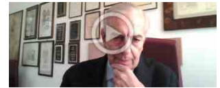
L'importanza della diagnosi dell'emicrania

Analizzando i valori della prevalenza periodale, si può vedere in che misura il COVID-19 ha raggiunto la popolazione italiana dall'inizio dell'epidemia ad oggi: in totale, indicativamente una persona su cinque (20,05%) in Italia è stata contagiata (il