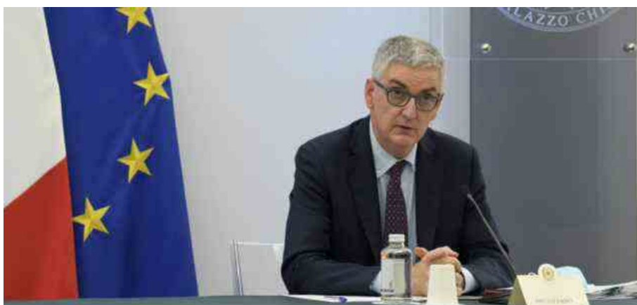
Conferenza stampa Covid: Silvio Brusaferrò, Presidente Iss

Atteso il monitoraggio Iss-Ministero della Salute per l'invio dei dati in Cabina di regia: cala ancora la curva Covid, verso allentamento restrizioni. Dati Gimbe: giù ricoveri e decessi