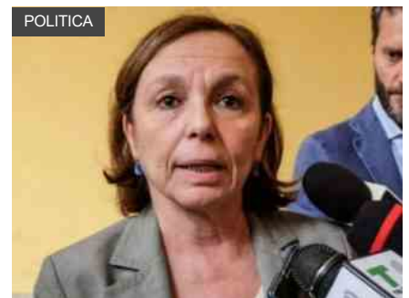
Migranti, con la ministra Lamorgese sono raddoppiati gli sbarchi

Entrando nel merito delle richieste avanzate dalle Regioni, nel documento mandato all'esecutivo ci sarebbe la proposta di tracciamento sulle persone che hanno rifiutato di adempiere alla campagna vaccinale e quindi concentrarsi in quei contesti dove il contagio è più probabile.