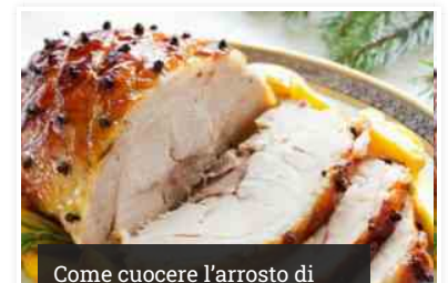
Come cuocere l'arrosto di