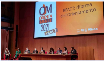
Assessori riuniti al salone Orientamenti 2021 di Genova