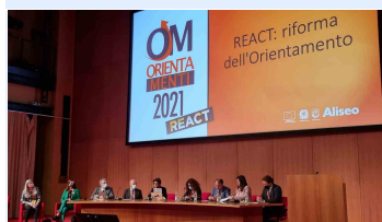
Assessori riuniti al salone Orientamenti 2021 di Genova