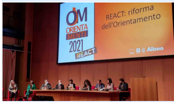
Assessori riuniti al salone Orientamenti 2021 di Genova