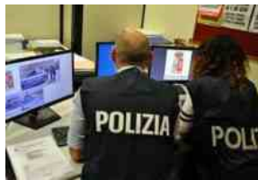
Isernia: Arrestato giovane per spaccio di stupefacenti