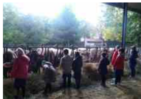
Educazione alimentare/Prosegue il progetto di Coldiretti Donne Impresa