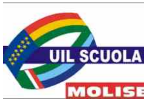
Manovra/UIL Scuola: la proposta del Governo delude le aspettative del mondo della scuola