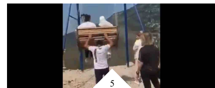
TRAGEDIA SFIORATA PER UN 'SELFIE': LA CORDA DELL'ALTALENA SI SPEZZA SUL CANYON, DUE RAGAZZE PRECIPITANO NEL VUOTO

Su Rai3, infine, alle 20, andrà in onda il docufilm "Genova, ore 11.36" per raccontare il crollo del Ponte Morandi da un punto di vista diverso e ridare dignità e memoria alle vittime, con le storie di quanti quel giorno furono coinvolti nell'incidente, testimoni oculari, soccorritori, forze dell'ordine.