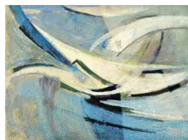
Figure & Figure. Opere dalla Fondazione Concordia Sette Pordenone in mostra

Sospesa l'anno scorso a causa della pandemia, l'esposizione è visitabile dal venerdì alla domenica