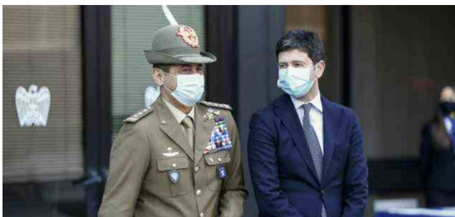
Emergenza Covid, il commissario Figliuolo e il Ministro Speranza

Il commissario all'emergenza Covid Figliuolo dà via libera ai vaccini in vacanza: come funziona e da quando. Novità su mascherine, scuola e terza dose