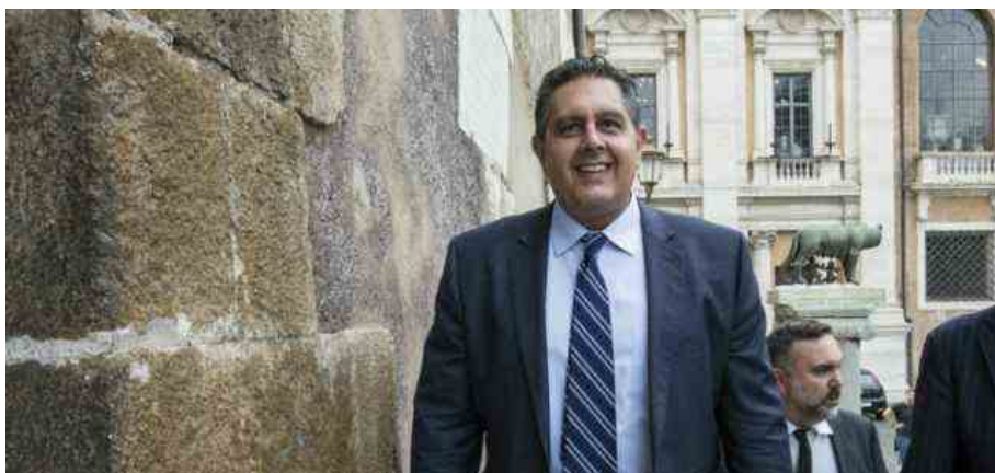
Giovanni Toti, governatore della Regione Liguria

Giovanni Toti ai microfoni de La Verità: "Ho sentito Draghi per confermarli il leale supporto dei nostri parlamentari al suo governo"