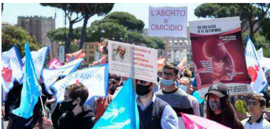
Aborto, manifestazione protesta "Pro Vita e Famiglia"

Aborto, lo studio dell'economista di "Pro Vita" contro la legge 194: "troppi finanziamenti con soldi pubblici, rischio salute per le donne". Bufera contro Benedetto Rocchi