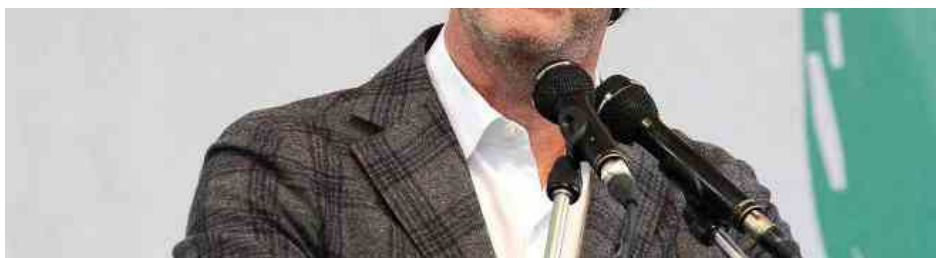
il governatore del Veneto Zaia

Venezia, 26 Maggio 2021 - La questione coprifuoco continua a tenere banco fra i presidenti di Regione e secondo quello del Veneto, Luca Zaia , sarà uno dei temi centrali dell'attività odierna della Conferenza delle Regioni: "Oggi avremo una serie di incontri con i colleghi per capire cosa intendiamo fare. Porterò l'idea che ci sia la possibilità di applicare le aperture. Il coprifuoco è da cancellare".