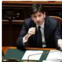
Coronavirus, Speranza "Dopo l'inverno vedremo la luce"