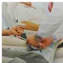
Stati Generali, infermieri illustrano a Conte il percorso futuro

SOSTIENI IL GIORNALE ADERENDO ALLA NEWSLETTER!