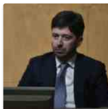
Coronavirus, Speranza "Non ne siamo ancora fuori"