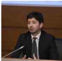
Coronavirus, Speranza "Da infermieri ruolo fondamentale"