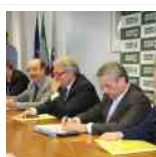
dalla Regione Marche