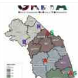
Gioco d'azzardo patologico: la