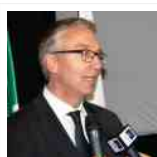
dalla Regione Marche