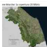
dalla Regione Marche