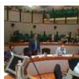
Regione Marche, approvato il Piano