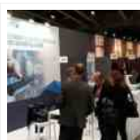
La Regione Marche