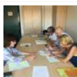
dalla Regione Marche