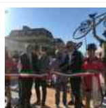
dalla Regione Marche