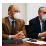
dalla Regione Marche