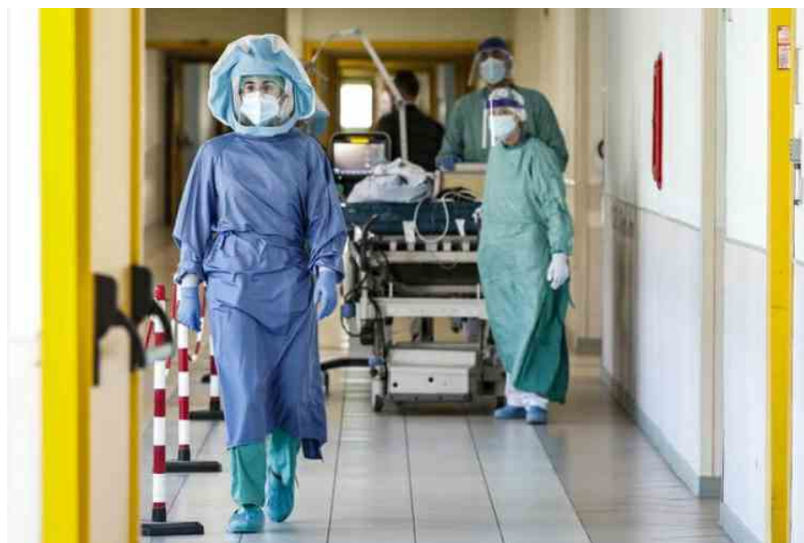
Operatori sanitari

La Fials scrive una lettera al ministro della Salute Speranza chiedendo una modifica del DPR 761/79 per dare agli operatori una corretta collocazione e la dignità che ne deriva