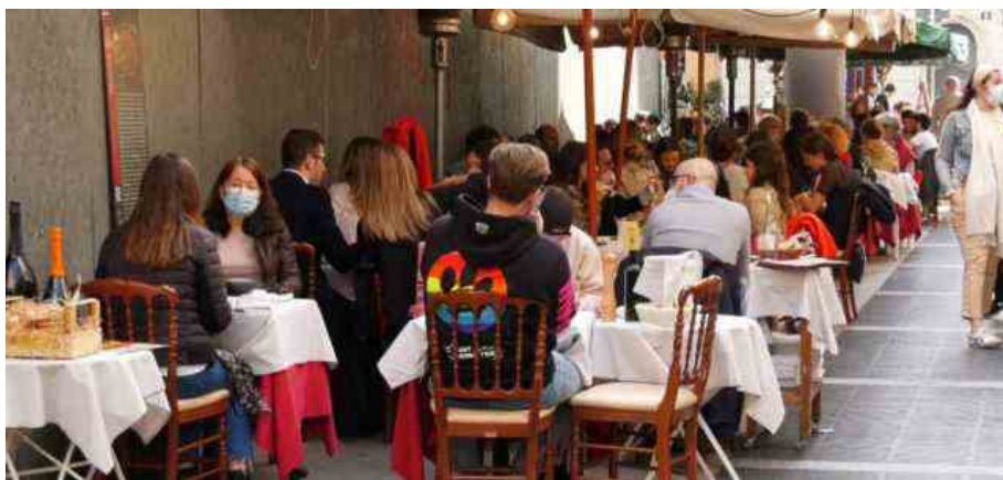
Riaperture a Milano: ristoranti in zona gialla (LaPresse, 2021)

Ci sono ragioni per essere ottimisti sulla ripresa dell'economia italiana, che dovrebbe viaggiare sugli stessi ritmi di quelle degli altri Paesi europei