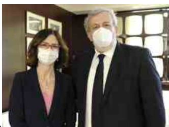
Guarda la gallery

"Inoltre la Giunta oggi ha già affrontato in termini di riequilibrio tra Nord e Sud la questione sanitaria. Noi siamo certi che tu e il tuo Governo farete in modo che i cosiddetti LEP, i livelli essenziali delle prestazioni, diventeranno il metro e la misura della distribuzione dei finanziamenti in materia socio sanitaria con l'aiuto anche degli investimenti che verranno dal Recovery Plan. Questo significa che la Puglia si candida a diventare una regione 'normale' . In realtà lo è già, noi non siamo commissariati, non abbiamo particolari problemi legati alla sanità, siamo in piano operativo, quindi l'ultima fase del riesame della nostra solidità finanziaria, e speriamo di poter soddisfare ogni esigenza".