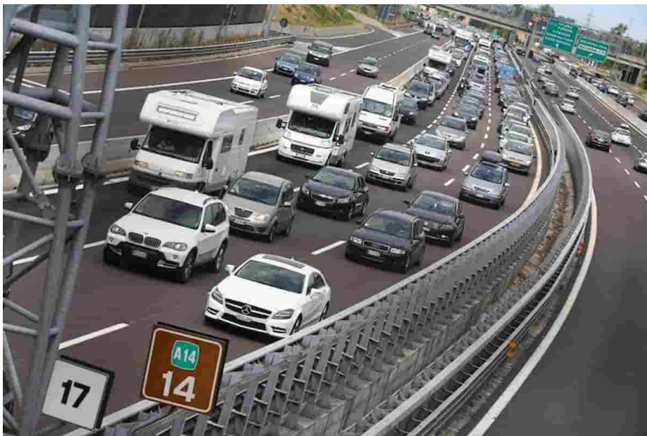
Pass per spostamenti tra regioni dal 26 aprile, 3 ipotesi: autocertificazione, tessera sanitaria, card

Publicato il 19 Aprile 2021 8:28 | Ultimo aggiornamento: 19 Aprile 2021 8:28