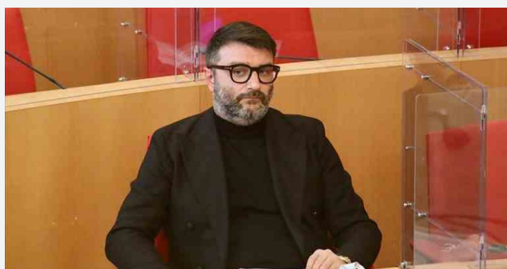
Giuseppe Tupputi © n.c.

POLITICA Barletta martedì 23 marzo 2021 di La Redazione