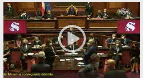
MARIO DRAGHI AL SENATO - MI DITE VOI QUANDO POSSO SEDERMI?