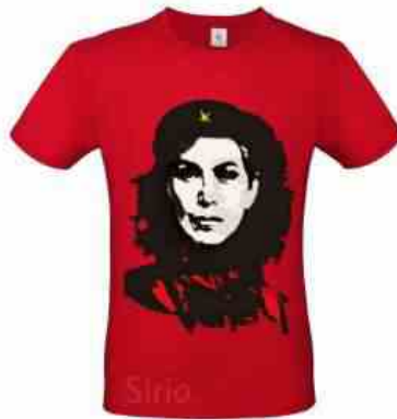
MEME SUL SOSTEGNO DI NICOLA ZINGARETTI A BARBARA DURSO