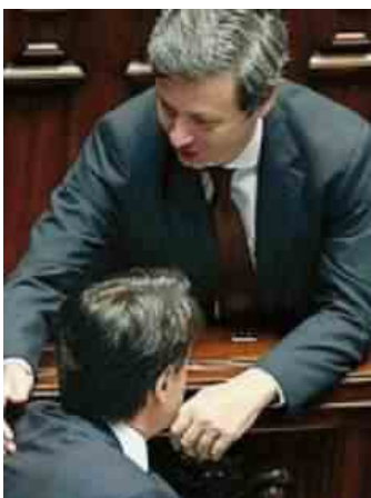
ANDREA ORLANDO E GIUSEPPE CONTE