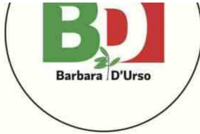
MEME SUL SOSTEGNO DI NICOLA ZINGARETTI A BARBARA DURSO