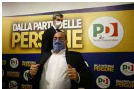
ANDREA ORLANDO NICOLA ZINGARETTI

Il titolare della Difesa ha placato gli animi di chi gli ha sottolineato che «noi veniamo trattati come degli appestati», e ha riconosciuto che «il tema esiste»: «Ma la verità è che senza di noi la scissione nel Pd sarebbe stata più pesante. Senza di noi, l'ambizione riformista di questo partito sarebbe andata persa».