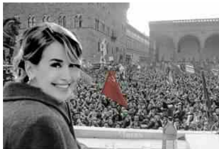
MEME SUL SOSTEGNO DI NICOLA ZINGARETTI A BARBARA DURSO