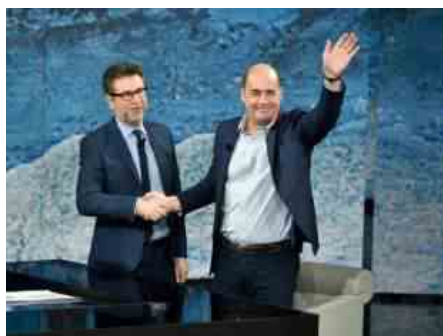
FABIO FAZIO NICOLA ZINGARETTI