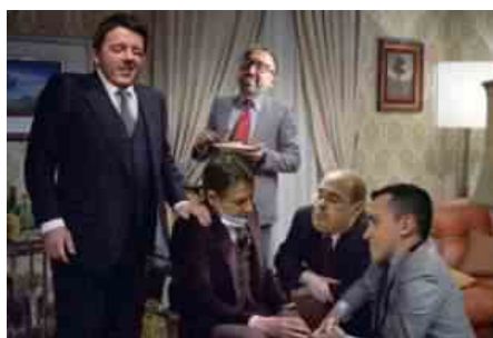
MATTEO RENZI ALFONSO BONAFEDE GIUSEPPE CONTE NICOLA ZINGARETTI LUIGI DI MAIO - AMICI MIEI