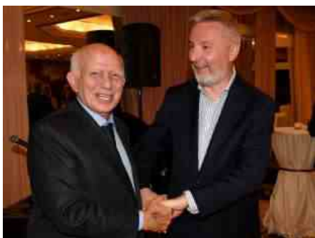
PAOLO CIRINO POMICINO E LORENZO GUERINI