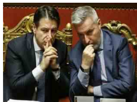
LORENZO GUERINI GIUSEPPE CONTE

In attesa delle assise, Guerini ritiene comunque opportuna una tregua interna. Ciò non toglie che in questa lunga fase di transizione serviranno regole chiare e anche pari dignità nel partito. Almeno è quello che si intuisce quando nei conversari ha spiegato che «noi abbiamo svolto un ruolo, abbiamo creduto e crediamo ancora nel Pd come forza del centrosinistra, dove convivono anime diverse. Adesso come si farà a gestire questa fase, dipenderà anche dalla sensibilità di chi è