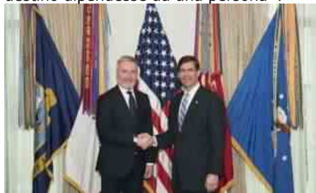
LORENZO GUERINI CON MARK ESPER

come «o Conte o al voto» - che hanno «schiacciato il partito quasi che il suo destino dipendesse da una persona».