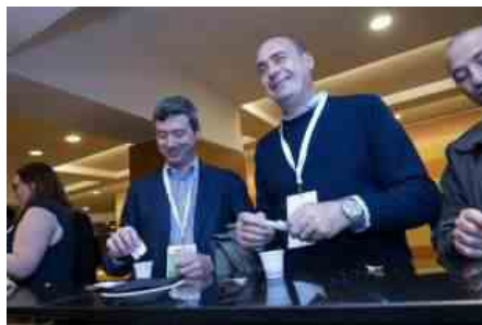
ANDREA ORLANDO E NICOLA ZINGARETTI