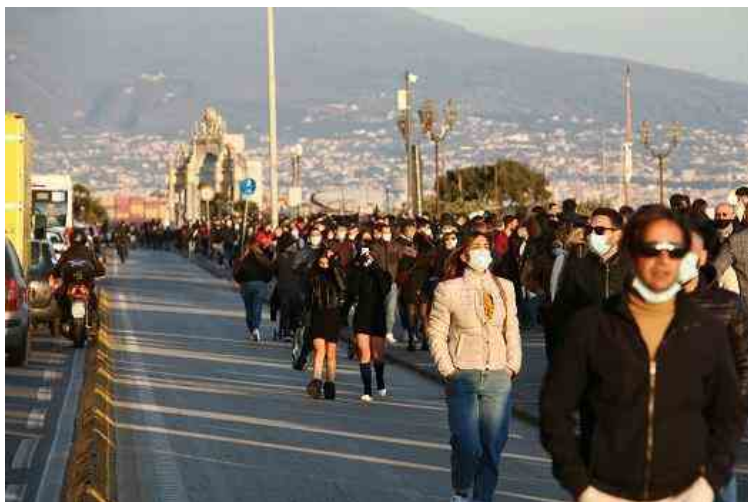
Covid, cambia la mappa dei colori: Regioni divise sulla zona unica

Nazionale - Covid, cambia la mappa dei colori: Regioni divise sulla zona unica