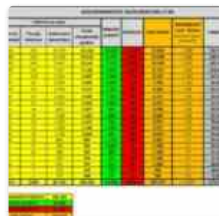
Coronavirus, 256 malati in piu' rispetto a ieri, vittime in calo