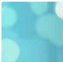
Coronavirus, cambiano colori regioni: la nuova mappa dell'Italia