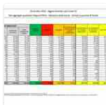
Coronavirus, 17.012 nuovi casi e 141 decessi