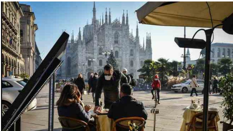
Zona gialla, a Milano riparte il servizio al tavolo nei bar

Milano, 30 gennaio 2021 - Da lunedì 1 febbraio la Lombardia sarà in zona gialla . Ma, attenzione, non è un 'liberi tutti': la regione passa semplicemente a un regime di regole attenuato rispetto a quello in vigore fino a domenica 31 gennaio.