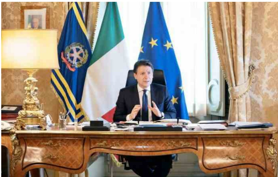
Il presidente del Consiglio, Giuseppe Conte, durante la videoconferenza con le Regioni a Palazzo Chigi, Roma, 03 aprile 2020.