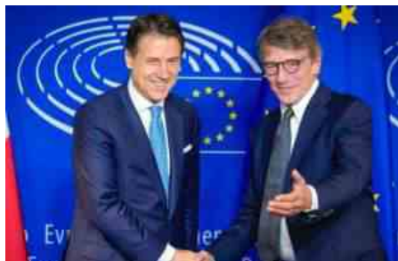
GIUSEPPE CONTE DAVID SASSOLI

(...) Dietro le quinte si racconta che i grillini abbiano usato le parole usate domenica scorsa da Sassoli per frenare l'intesa in Europa, alla quale avrebbero invece in precedenza