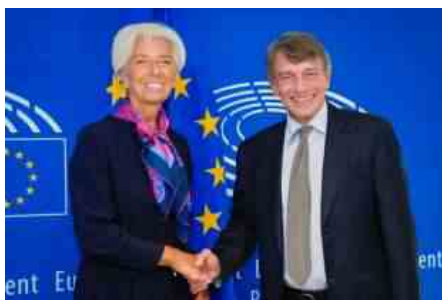
CHRISTINE LAGARDE DAVID SASSOLI