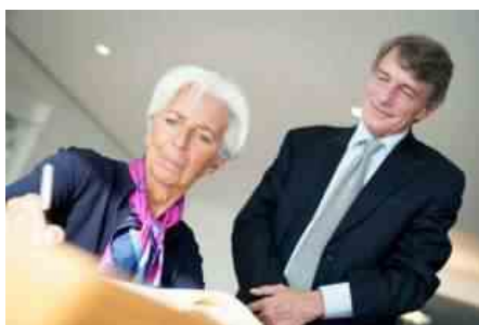
CHRISTINE LAGARDE DAVID SASSOLI 2