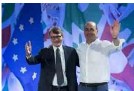
DAVID SASSOLI NICOLA ZINGARETTI