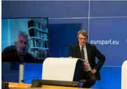
DAVID SASSOLI BEPPE GRILLO

«In questo momento serve coraggio, siamo in un passaggio decisivo per l'Unione e non ci possono essere tabù nell'affrontare gli strumenti che hanno