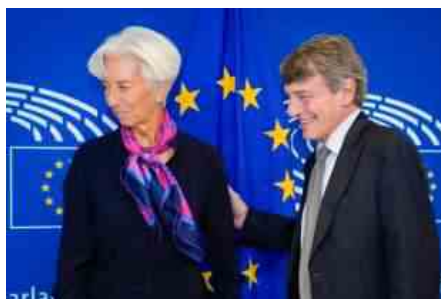
CHRISTINE LAGARDE DAVID SASSOLI 1

1 - LAGARDE, CANCELLARE DEBITO? È CONTRO I TRATTATI (ANSA) - "Leggo sempre con interesse tutto quello che dicono i rappresentanti del Parlamento Ue e soprattutto i presidenti, la mia risposta" all'idea di Sassoli di cancellare il debito contratto dai Paesi con la Bce "è molto corta: tutto quello che va in quella direzione è contro i trattati, c'è l'articolo 103 che proibisce quel tipo di approccio e io rispetto i trattati": lo ha detto la presidente della Bce Christine Lagarde rispondendo a una domanda dell'eurodeputato Marco Zanni (Lega) durante l'audizione alla commissione econ.