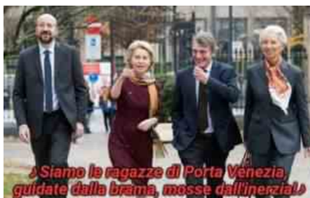
CHARLES MICHEL URSULA VON DER

Se verrà superata, il Pd spingerebbe per l'ok alla riforma a fine novembre. Tanto che per superare il "no" grillino all'accordo in Europa è pronto a chiedere un vertice di maggioranza. Più difficile invece superare lo stop del Movimento all'uso dei 36 miliardi per rispondere al Covid. Il Pd resta a favore, ma prima di riaprire il fronte con l'M5S aspetta di capire quanto durerà la seconda ondata pandemica e quanti danni provocherà all'economia italiana. In caso di necessità, tornerà alla carica.