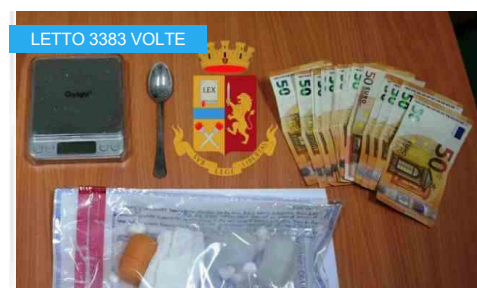
Castellammare - Vendeva droga in piazza Giovanni XXIII, arrestato dalla polizia