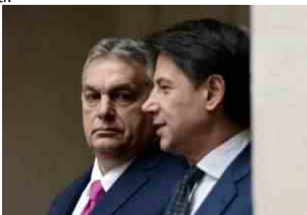
VIKTOR ORBAN GIUSEPPE CONTE

Agli occhi della Commissione di Bruxelles l'occasione del Recovery serve anzitutto a questo: creare le condizioni perché l'industria europea esca dall'emergenza più forte e coesa di prima. L'invito è di evitare la richiesta di fondi a pioggia e l'obbligo a concentrarsi su due capitoli: ambiente e tecnologia. Per l'Italia la trattativa sul Recovery vale molto di più di questo: il debito sfiora il 160 per cento del Pil.