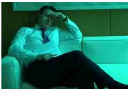
GIUSEPPE CONTE IN UN MOMENTO DI PAUSA DURANTE LE TRATTATIVE SUL RECOVERY FUND

E' per questo che il Pd continua a premere per l'attivazione della linea di credito, anche se nel M5S continuano le resistenze di una pattuglia di irriducibili che a palazzo Madama potrebbero far mancare il proprio sostegno. Numeri esigui ma il tema impatta sul congresso permanente del M5S, e mentre Giuseppe Conte frena e rinvia, i dem sembrano aver perso la pazienza anche perché il loro obiettivo è avere i 36 miliardi del Mes disponibili già con la legge di bilancio che dovrà essere approvata entro dicembre.