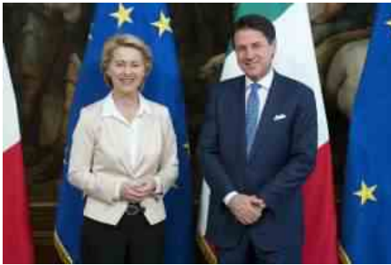
URSULA VON DER LEYEN INCONTRA GIUSEPPE CONTE A PALAZZO CHIGI 1

presidente della commissione Finanze di Montecitorio.