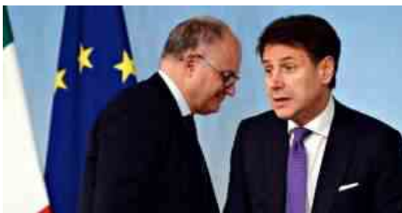
ROBERTO GUALTIERI GIUSEPPE CONTE

La promessa fatta da Conte di una riscrittura dei decreti sicurezza, del reddito di cittadinanza e l'abolizione di Quota100, sembrano tutte concessioni ai dem nel tentativo di rinviare la questione del Salva-stati, ma - visto tempi e toni del dibattito dentro il M5S - il nodo rischia di aggrovigliarsi legando sempre più l'esecutivo Conte al destino del Movimento.