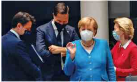
CONTE RUTTE MERKEL URSULA

I tempi per l'entrata in funzione del Recovery potrebbero infatti slittare anche se ieri il commissario Ue all'Economia Paolo Gentiloni si è detto «fiducioso» e ha fatto riferimento ad una nuova proposta della presidenza tedesca che potrebbe mettere d'accordo il Parlamento Ue con quei paesi - Ungheria in testa - che non accettano condizioni in materia di stato di diritto.