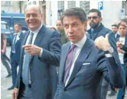
NICOLA ZINGARETTI E GIUSEPPE CONTE

Ma Gentiloni è anche tornato sul Mes ripetendo che sul prestito «non ci sono condizionalità» e che l'Italia ha «necessità» di rafforzare il sistema sanitario con risorse che «convergono a Paesi come il nostro, che pagano tassi più elevati rispetto ad altri». In effetti a paesi come la Germania, Francia, e persino la Spagna - che si finanziano sul mercato a tassi molto bassi se non negativi - il prestito non conviene e non lo chiedono, ma per l'Italia si tratta di un risparmio di una decina di miliardi.