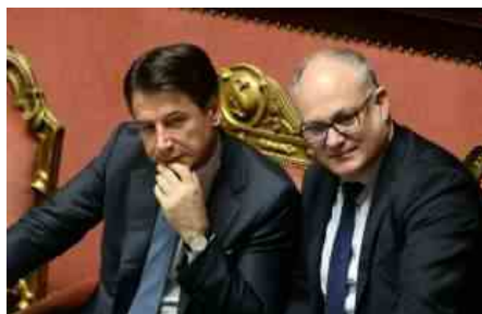
GIUSEPPE CONTE ROBERTO GUALTIERI MES

«Per il prestito del fondo salva-Stati abbiamo tempo fino a dicembre». Mai come in queste ore Giuseppe Conte e Roberto Gualtieri devono fare propria una regola aurea della