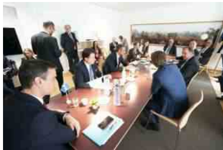
SANCHEZ CONTE RUTTE ALLA DISCUSSIONE SUL RECOVERY FUND

La partita è complessa, ma di lì passa la sopravvivenza del governo. L'ostacolo è l'accordo sul bilancio fra i ventisette partner dell'Unione. Senza di esso i tempi per l'avvio della procedura rischia di slittare ben oltre il primo gennaio, data formale fissata dalla Commissione. Ungheria e Polonia hanno posto il veto alla proposta di legare la concessione degli aiuti al rispetto dello stato di diritto.