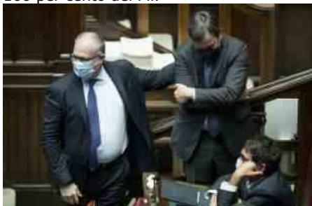
ROBERTO GUALTIERI ENZO AMENDOLA