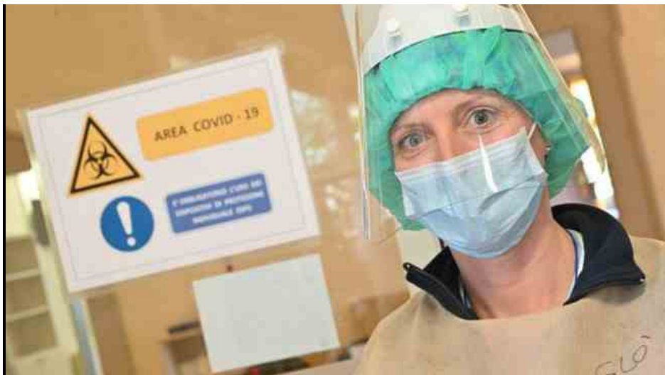
Il bollettino coronavirus di oggi in Emilia Romagna

Bologna, 14 settembre 2020 - Meno tamponi e meno contagi di ieri: sono 127 i nuovi positivi al coronavirus rilevati dalla Regione in Emilia Romagna nelle ultime ore ( ieri i positivi sono stati 143 ). Ma i tamponi processati sono appena 4.880 (ieri, che era domenica erano stati oltre 6.100). A livello italiano, i