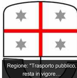
Regione: "Trasporto pubblico, resta in vigore..."