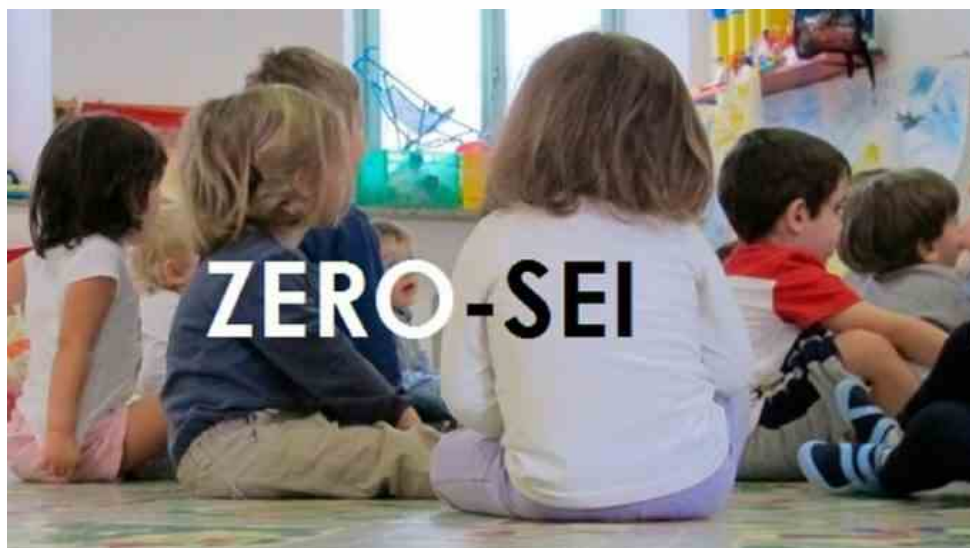
Riapertura scuole, riunito Tavolo Nazionale per ripresa sistema integrato zero-sei

Il Ministero dell'Istruzione , attraverso un comunicato, ha informato in merito alla riunione del Tavolo nazionale per la ripresa delle attività in presenza del sistema integrato 0-6 anni: al confronto era presente la viceministra dell'Istruzione, Anna Ascani .