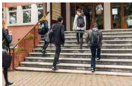
Studenti mentre entrano in una scuola superiore

Sulle Linee Guida per il ritorno a scuola a settembre, la cui approvazione continua ad essere rimandata , il ministero dell'Istruzione sarebbe venuto incontro alle richieste delle Regioni su almeno due punti: l'incremento di organico, quindi più docenti e Ata, da utilizzare negli spazi aggiuntivi che si verranno a creare; lo stanziamento di fondi per la manutenzione e adeguamento strutturale delle scuole.