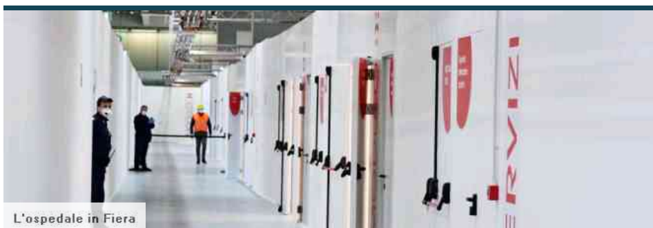
L'ospedale in Fiera

L'ospedale in Fiera diventa parte integrante del piano di rafforzamento delle terapie intensive. Avrà «un ruolo specifico»: insieme a quello di Bergamo si attiverà in caso di «allerta di livello 2» dell'epidemia.