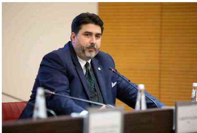
Christian Solinas