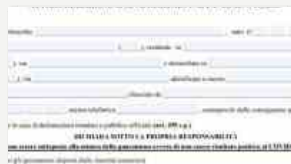
Dal 3 giugno via libera