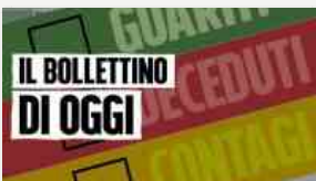
Coronavirus, bollettino 31