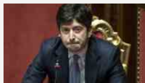
Fase due, Speranza: "Il