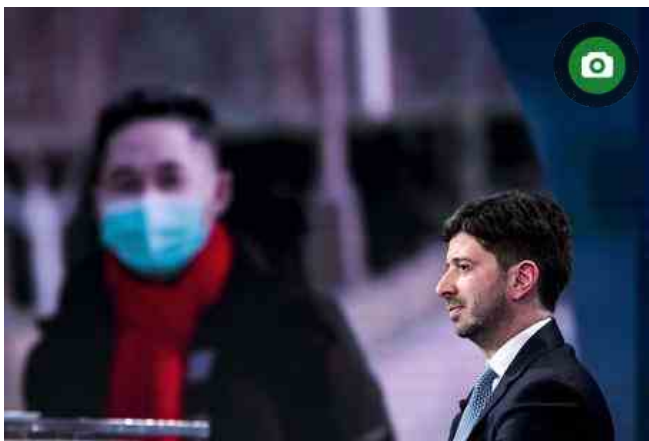
Roberto Speranza, ministro della Salute