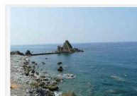
Bandiere blu, Liguria in testa con 32 località