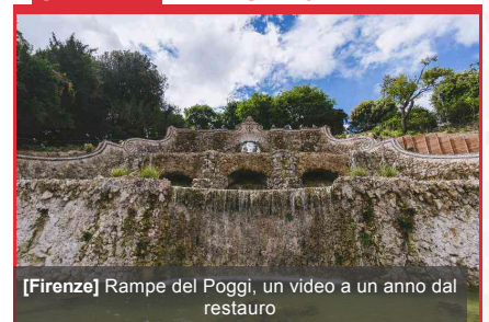
[Firenze] Rampe del Poggi, un video a un anno dal restauro