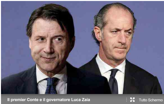
Il premier Conte e il governatore Luca Zaia

LEGGI ANCHE: «Riaperture, ok a nostre richieste» Oggi l'ordinanza