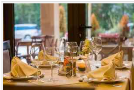
Il tavolo di un ristorante

È consigliata la misurazione della temperatura corporea, impedendo l'ingresso a chi ha più di 37,5. Nei locali devono esserci igienizzanti per le mani, quasi sempre le mascherine sono obbligatorie, mentre si