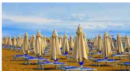
Spiaggia - Ombrelloni

consiglia di utilizzare la prenotazione al ristorante, ma anche dal parrucchiere e in spiaggia. Per 14 dovranno essere conservati i nominativi dei clienti che hanno prenotato.