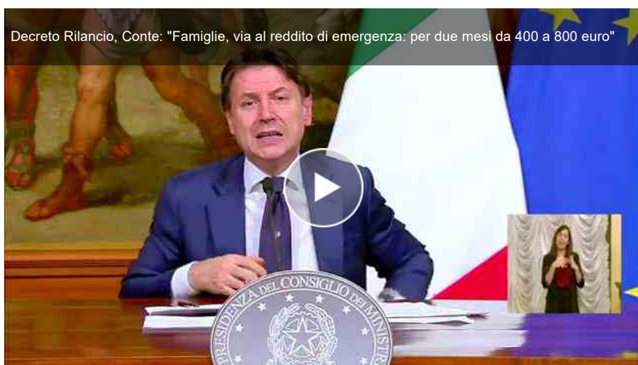
Decreto Rilancio, Conte: "Famiglie, via al reddito di emergenza: per due mesi da 400 a 800 euro"