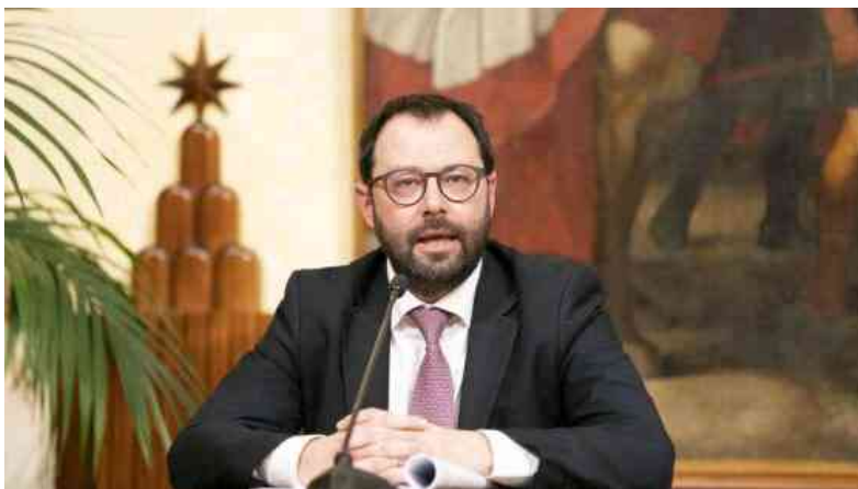
Stefano Patuanelli, ministro dello Sviluppo economico

Il ministro dello Sviluppo apre a una ripartenza differenziata su base territoriale. Intanto il nuovo numero uno degli industriali Bonomi dice: "La salute passa anche per il lavoro. E ci sarebbe piaciuta la presenza di almeno un imprenditore nella task force di Colao"