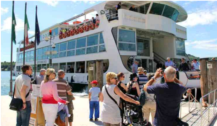
Turisti all'attracco del battello in piazza Vittoria, a Salò.